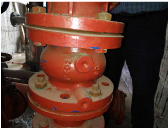
Είδος α/α 7: