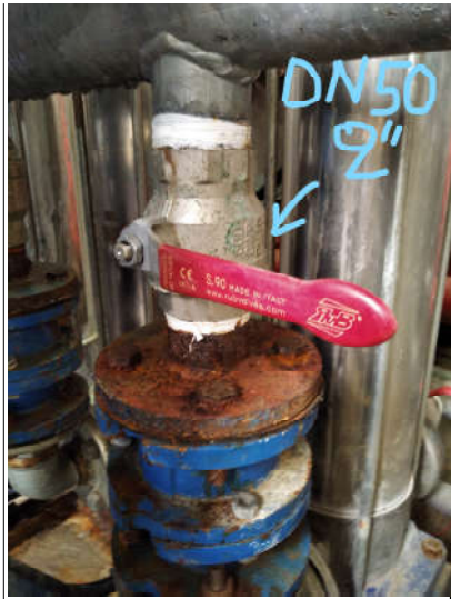
Είδος α/α 5: