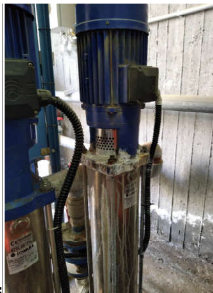
Είδος α/α 2: