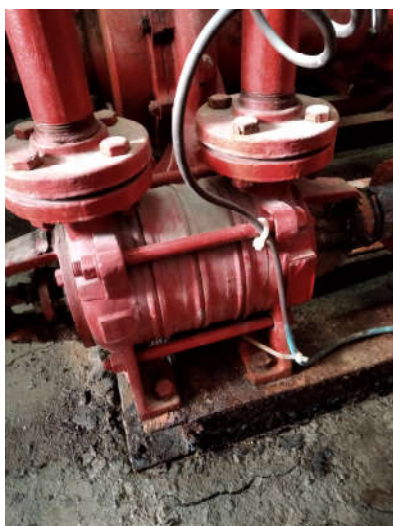
Είδος α/α 3: