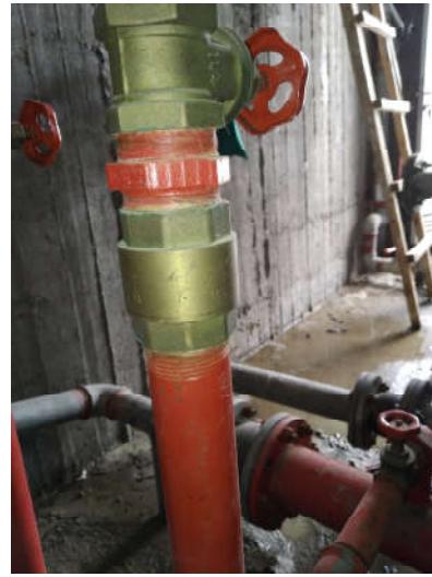
Είδος α/α 6: