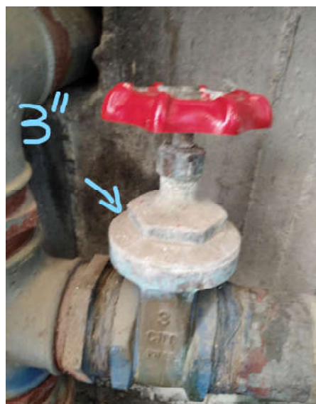
Είδος α/α 8: