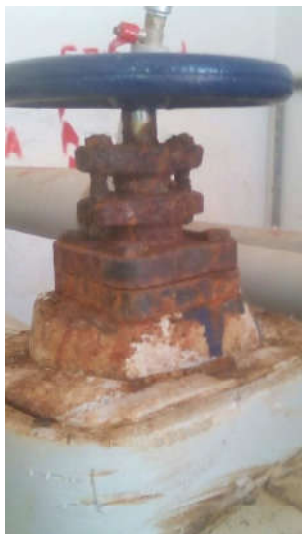
Είδος α/α 1: